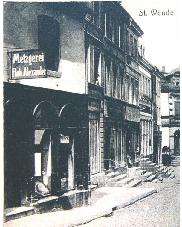
Foto: Metzgerei Alexander, Luisenstraße 27

Die Führung lässt u.a. mit Hilfe von Fotos dieses vergangene Leben wieder auferstehen.