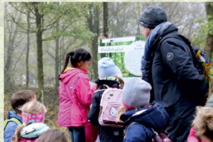
Die Waldregeln an der Eingangstafel erklären, wie man sich im Wald verhält wie z. B.: